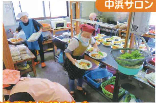
久しぶりにサロンで食事を作りました。