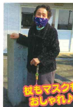
杖もマスクもおしゃれ♪