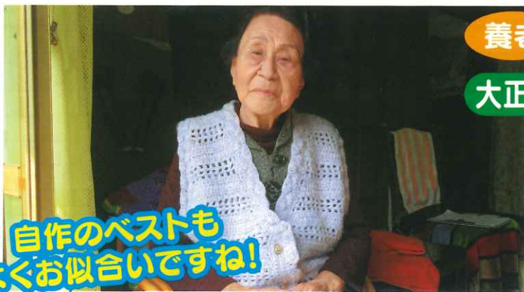
自作のベストもよくお似合いですね！