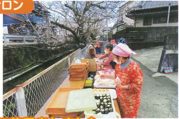
地域住民が集まって花見をしました。