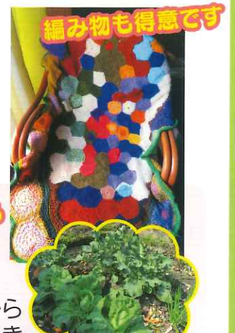
編み物も得意です