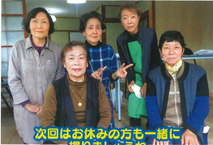
次回はお休みの方も一緒に撮りましょうね

天神町ほのぼのサロンは、市街地区区長会事務所で年4回行われています。ボランティアさんも参加者の方も区別なく、出来る人が出来ること手伝い、皆さんとても協力的です。