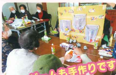
ゲームも手作りです