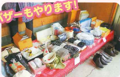
バザーもやります！