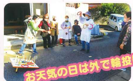
お天気の日には外で輪投げ